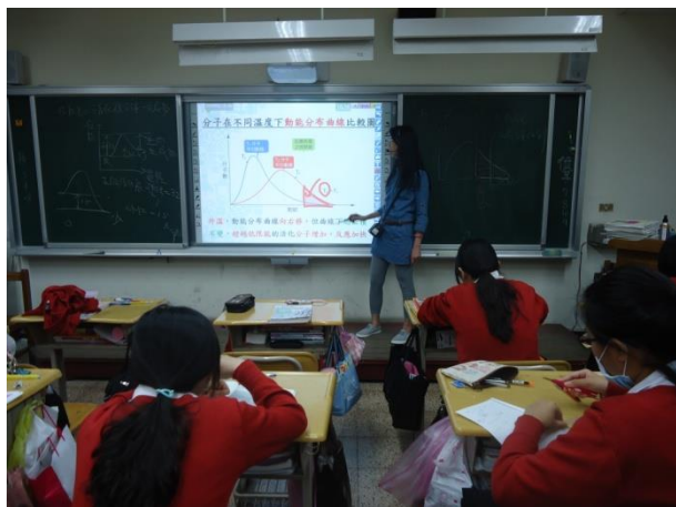
(電子白板解釋分子動能)